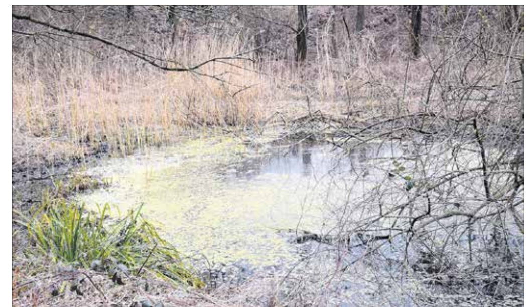
Auen und Tümpel wie dieser sind bevorzugte Laichplätze für Amphibien aller Art.

Ins Wasser springende Weibchen werden vom Männchen sofort umklammert und bis zur Besamung des Laichballens festgehalten. Ein Weibchen produziert zwischen 400 und 1200 Eier und gibt diese in Form eines kom-