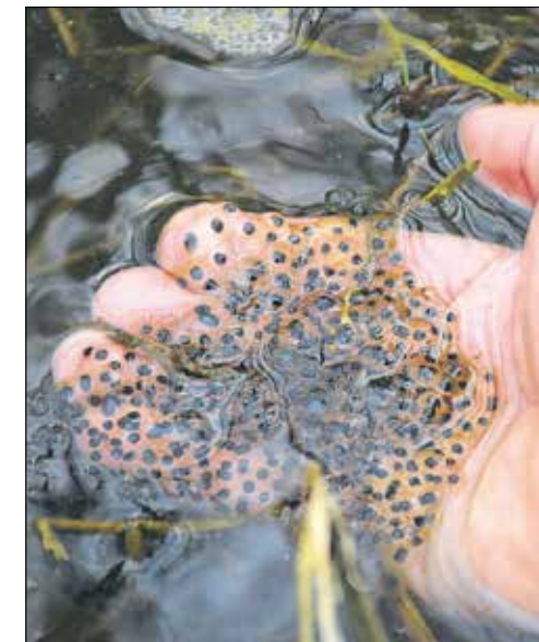
Laichballen fühlen sich gallertartig an.