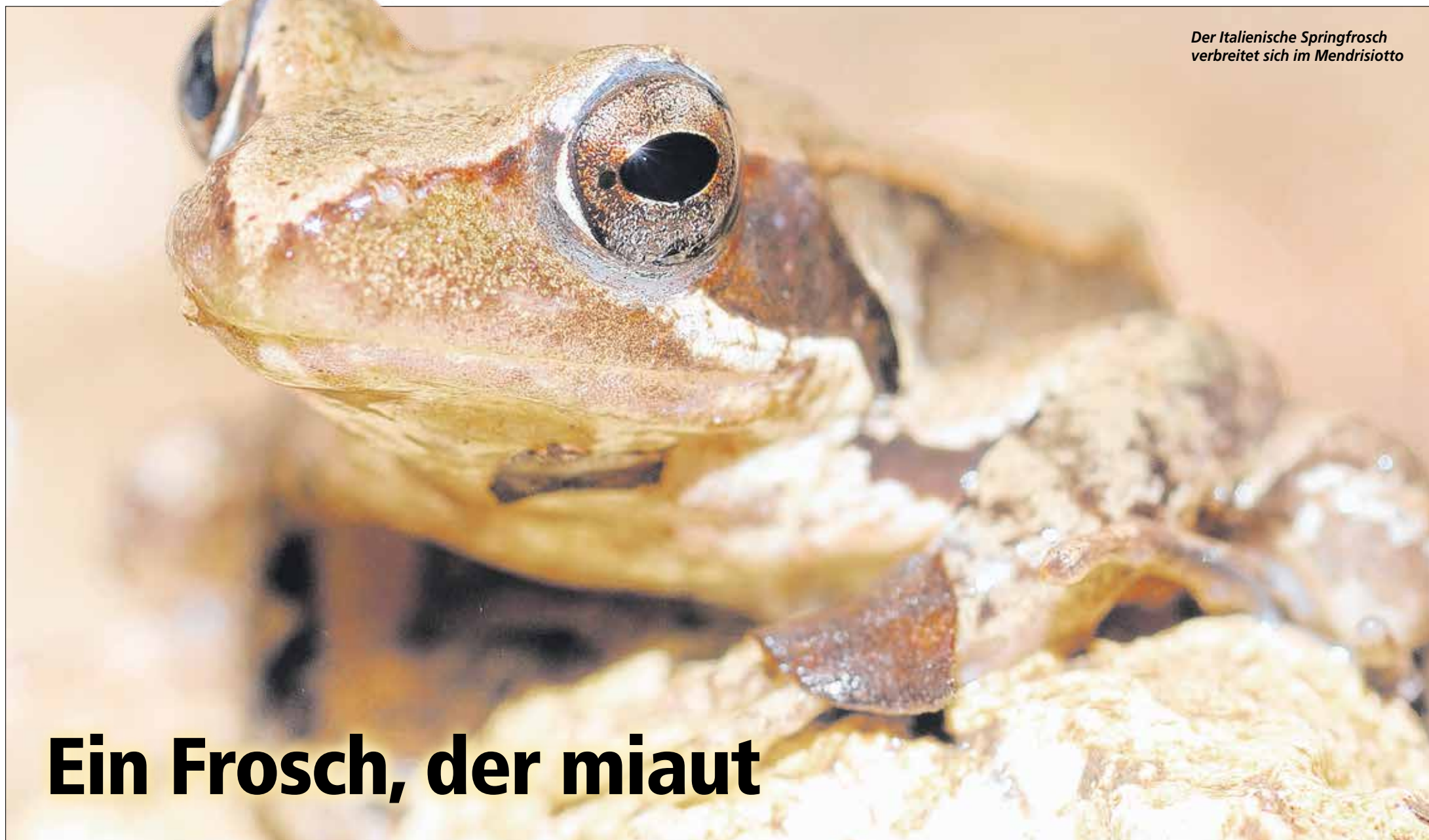
Der Italienische Springfrosch verbreitet sich im Mendrisiotto